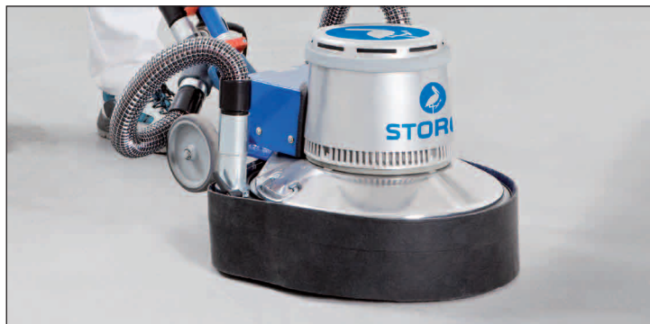
Na obrázku je příslušenství

Odsávací manžeta pro odsávání prachu při broušení: prakticky bezprašné pracovní prostředí = ochrana zdraví